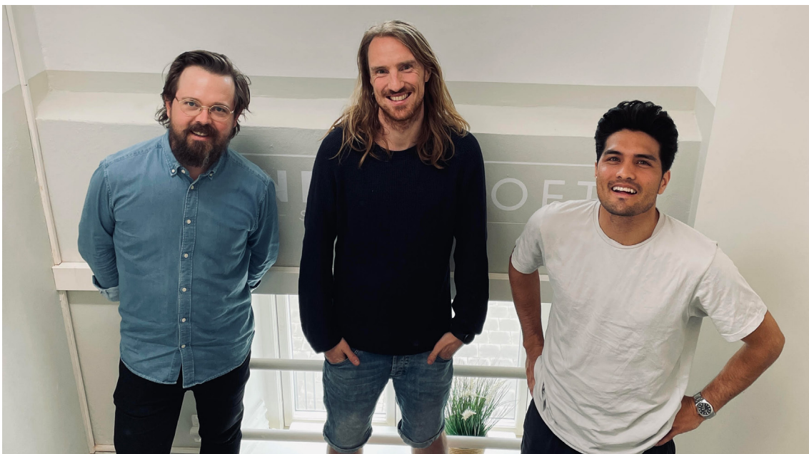
Piffi (Open Play)

För att kunna informera och stödja verksamheter i hela regionen, ge det stöd som behövs innan och under investeringsprocessen och utveckla verksamheten har projektstödet från Västra Götalandsregionen varit oerhört viktigt. Vi är stolta över att de flesta av våra investeringar tydligt bidrar till de långsiktiga prioriteringarna i Västra Götalandsregionens utvecklingsstrategi 2021-2030. Under 2021 gjordes investeringar i en bredd av sociala företag, från arbetsintegrering och nya bostadslösningar, som bidrar till ökad inkludering och innovationskraft, till cirkulära affärsmodeller som kan bidra till en mer hållbar region. Investeringen i det sociala företaget Open Play fungerande som en katalysator som möjliggjorde att företaget fick tillgång till fler investeringar och finansiering och på kort tid kunde gå från prototyp till att skala upp sin hälsofrämjande delningslösning för fritidsutrustning i parker och etablera ett första kommunalt samarbetsavtal med Göteborgs stad. Vi kan nu fortsätta stödja fler innovativa verksamheter i hela regionen tack vare att vi under slutet av 2021 beviljades ett nytt 3-årigt stöd från Västra Götalandsregionen. Under 2021 arbetade vi även för att ytterligare stärka vårt kapital samt hitta fler källor för att säkra medel för drift och utveckling.