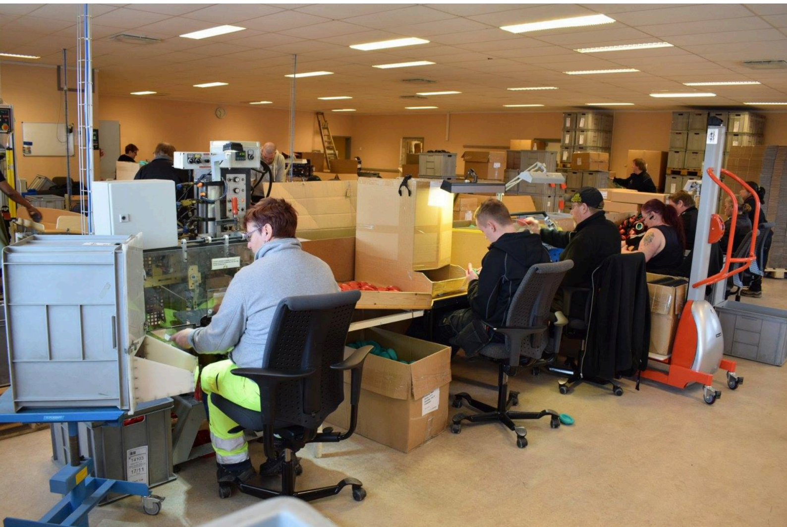
Foto från Koopus i Hedemora, en av våra garantitagare.

Coompanion Sverige Ekobanken Medlemsbank Hela Sverige ska leva JAK Medlemsbank Mikrofonden Väst Mikrofonden Öst Mikrofonden Örebro län Mikrofonden Halland Mikrofonden Skåne Mikrofonden Z Mikrofonden Östergötland Coompanion Kronoberg Fackförbundet Kommunal Mikrofonden Uppsala län